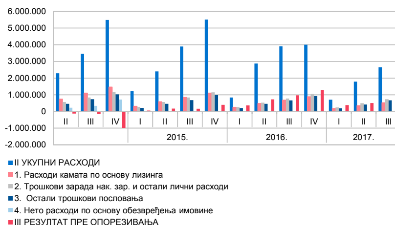
Графикон 3. Структура расхода

Структура најзначајнијих расхода приказана је у Графикону 3 – Структура расхода .