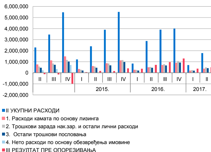
Графикон 3. Структура расхода

Збирни биланс успеха свих давалаца финансијског лизинга у хиљадама динара, на дан 30. јуна 2016. године и 30. јуна 2017. године, дат је у Табели 6.