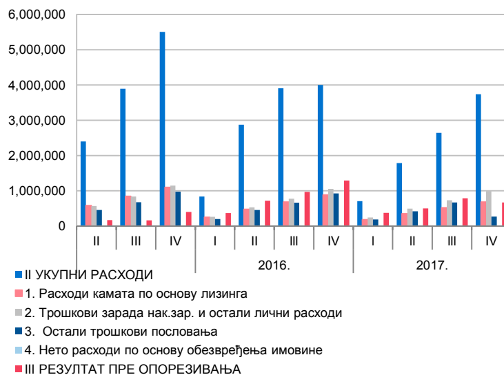
Графикон 3. Структура расхода

Структура најзначајнијих расхода приказана је у Графикону 3 – Структура расхода.