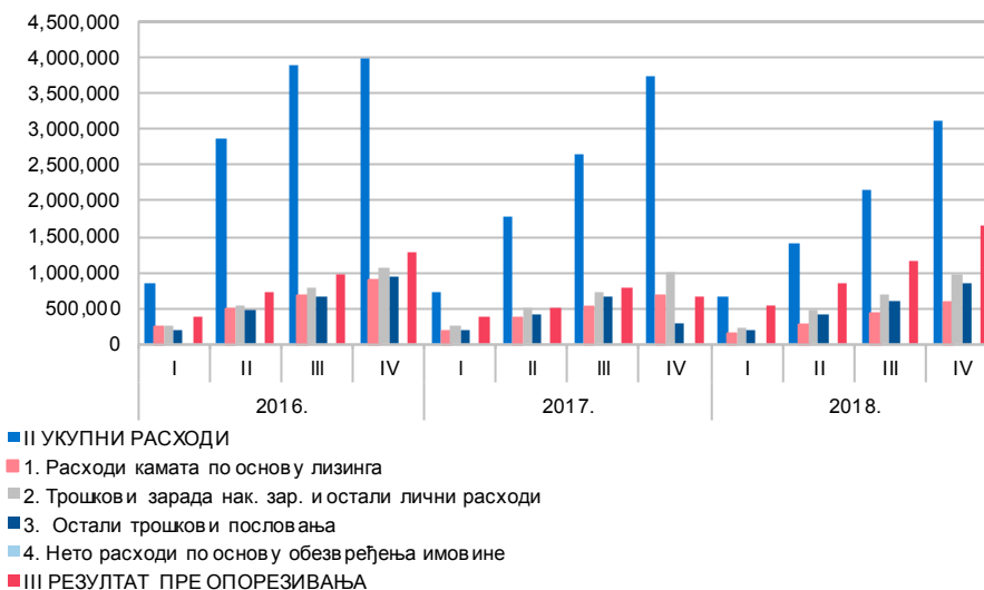
Графикон 3. Структура расхода

Структура најзначајнијих расхода приказана је у Графикону 3 – Структура расхода .