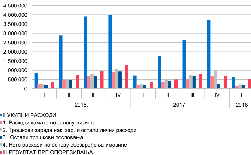
Графикон 3. Структура расхода

Структура најзначајнијих расхода приказана је у Графикону 3 – Структура расхода.