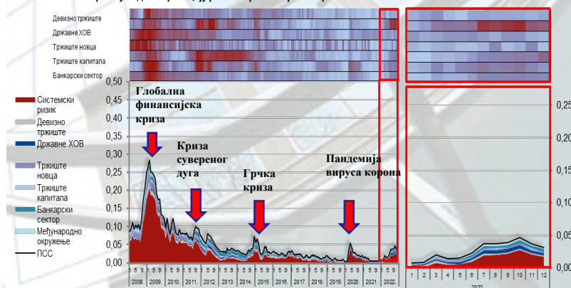
Кретање Показатеља системског стреса и приказ доприноса најзначајнијих фактора ризика Показатељу системског стреса уз идентификацију режима финансијског стреса