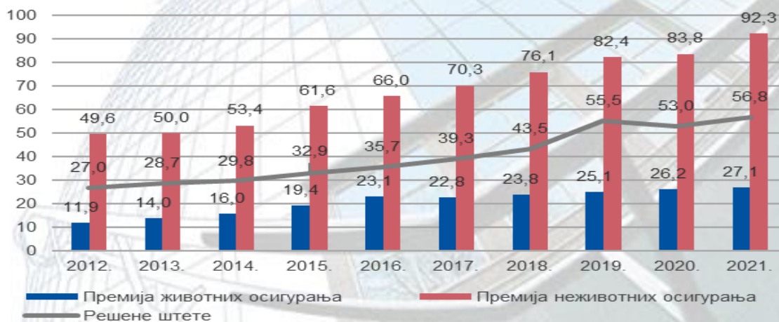
Укупна премија и решене штете тржишта осигурања, у милијардама динара

2) Податак о премији је обрачунат према просечном годишњем курсу Народне банке Србије за односну годину, док је за број становника примењен процењен број становника (годишњи просек).