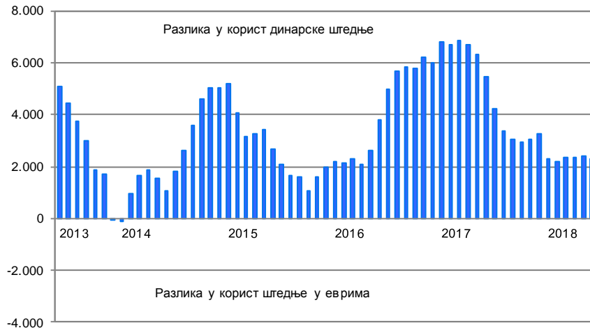
Графикон 4. Исплативост штедње орочене на годину дана (у RSD)