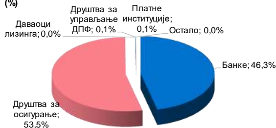
Графикон - Број притужби по даваоцима финансијских услуга (%)